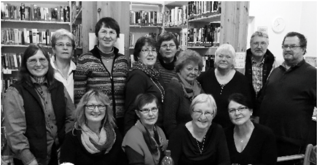
Das Team von „Treffpunkt Buch“